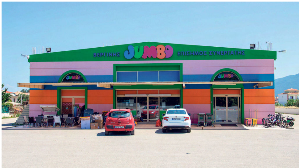
סניף ג'מבו ביוון. 10 חנויות ענק אמורות להיפתח בישראל

עוד כותבת ג'מבו סטוק בתגובתה לסירוב של הרשת היוונית: "המבקשת היא אשר קבעה את זהותה של העדה. המבקשת ידעה מראש, כי על העדה להיחקר על עדותה בישראל. המבקשת היא אשר דרשה דיון דחוף בתיק זה. וכעת המבקשת מתנגדת להתייצבות העדה בישראל. בכל הכבוד, המבקשת אינה יכולה לאכול את העוגה ולהשאיר אותה שלמה. אם זו העדה שהמבקשת מעוניינת להעיד – תתכבד המבקשת ותדאג להגעת העדה לישראל. אם העדה אינה מעוניינת להגיע לישראל, המבקשת יכולה לבחור האם להעיד אחר במקומה – או למשוך את עדותה. אם הבעיה היא במועדים – הרי שהמבקשת היא שביקשה דיון במועד קרוב. אם לוחות הזמנים לא מסתדרים למבקשת, המבקשת יכולה לבקש דחייה".